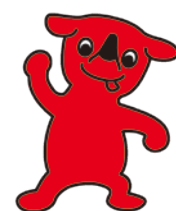
千葉県 マスコットキャラクター チーバくん